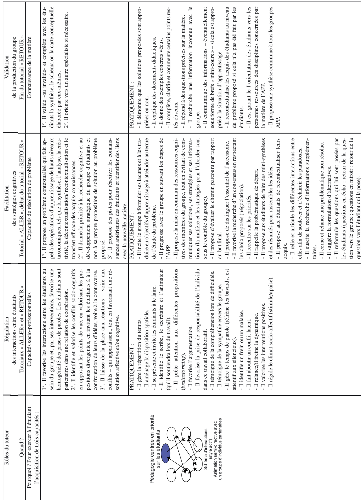
Tableau IV. Support pratique pour un style actif d'animation dans un dispositif d'apprentissage par problèmes (APP).