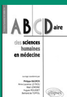
ABCDaire des sciences humaines en médecine